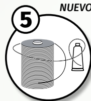
NUEVO HILO BRILLANTE