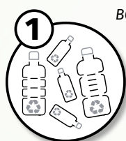
BOTELLAS PET RECICLADAS